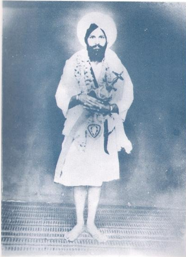
ਸੰਤ ਗਿਆਨੀ ਕਰਤਾਰ ਸਿੰਘ ਜੀ 'ਖਾਲਸਾ' ਭਿੰਡਰਾਂਵਾਲੇ ਦਮਦਮੀ ਟਕਸਾਲ ਦੇ ਮੁੱਖ ਸੇਵਾਦਾਰ ਵਜੋਂ ਸੇਵਾ ਸੰਭਾਲਣ ਸਮੇਂ